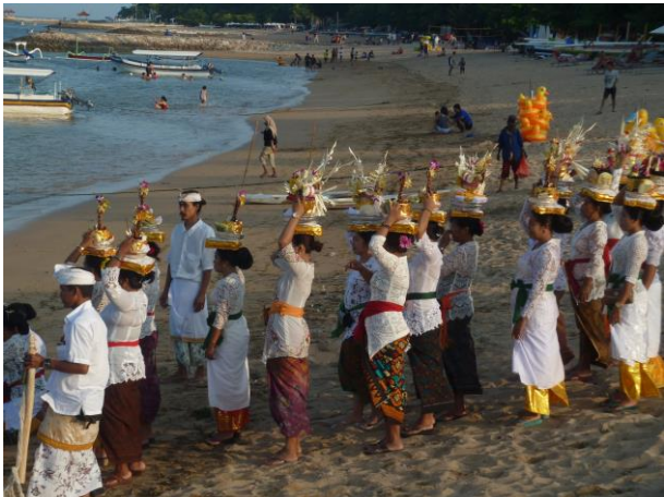
Plechtigheid in de namiddag op het strand bij Seminyak

Vanuit Ketapang een excursie naar de Ijen vulkaan, op het Ijen-plateau, waar zwavel gewonnen wordt.