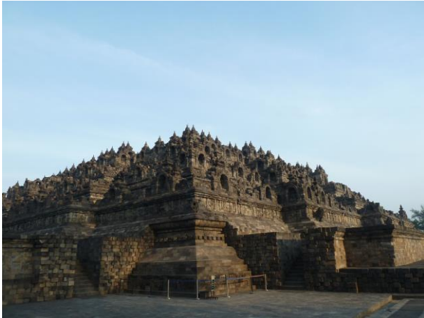
's Morgens vroeg heb je de Boroboedoer bijna voor je alleen